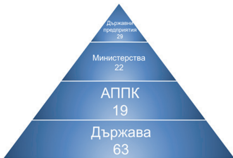
Фигура 2. Изпълнение на принципите на ОИСП от институциите през 2020 г., брой точки

При използване на пирамидата на разпределение на обхвата на принципите на корпоративно управление, разработена в доклада за оценка на корпоративното управление през 2016-2018 г., се получава разпределението представено на Фигура 2. 16