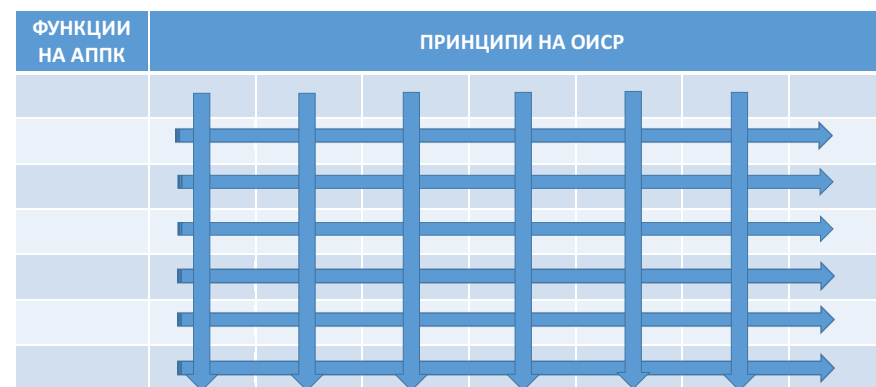
Фигура 1. Подход за оценка на съответствието на принципи на ОИСР с функции на АППК

В настоящия доклад ще включим нова компонента от оценката, която обхваща Агенцията за публичните предприятия и контрол (АППК). Агенцията е създадена с цел да координира управлението на държавната собственост като въвежда модерните принципи на корпоративно управление в държавния сектор. Агенцията се явява междинно звено между Министерски съвет и министерствата–принципали. На нея са вменени както функции, които следва да се изпълняват както от Министерския съвет, така и от министерствата. Допълнително тази агенция е натоварена с методологически задачи, свързани с развитие на инструментариум за налагане на принципите на ОИСР за корпоративно управление. За оценка на съответствието на принципите на ОИСР, относими към АППК чрез възложените ѝ по закон функции, е разработен специален подход, чиято идея е представена графично на Фигура 1. Там в табличен вид се кръстосват част от принципите на ОИСР, които се отнасят до държавата и министерствата и които са прехвърлени за изпълнение чрез Закона за публичните предприятия на АППК. Агенцията като междинно звено изпълнява самостоятелно или в сътрудничество с другите органи на изпълнителната власт принципите на ОИСР. Така в страната е наложен смесен модел на корпоративен надзор върху държавните предприятия, които съдържа елементи на централизирания и децентрализирания модел. 15